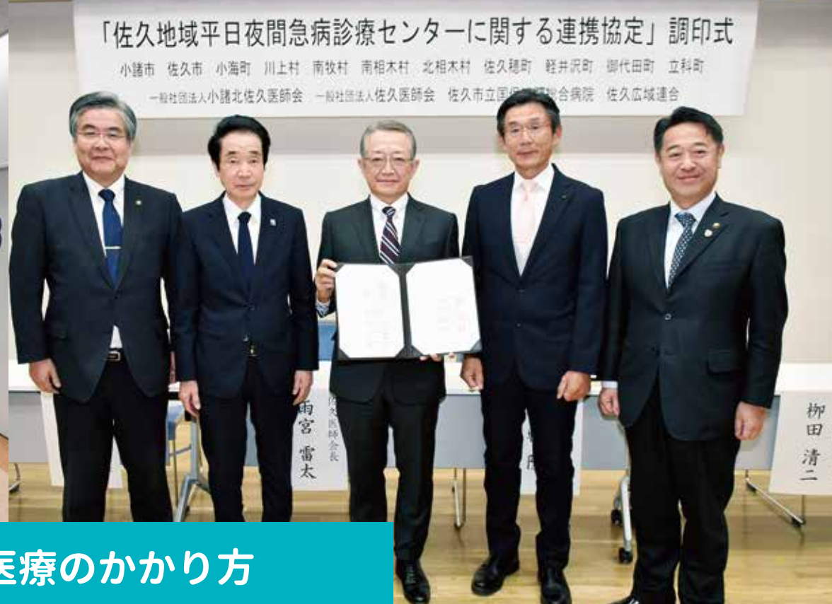
「佐久地域平日夜間急病診療センターに関する連携協定」調印式 小諸市 佐久市 小海町 川上村 南牧村 南相木村 北相木村 佐久穂町 軽井沢町 御代田町 立科町 一般社団法人小諸北佐久医師会 一般社団法人佐久医師会 佐久市立望月総合病院 佐久広域連合