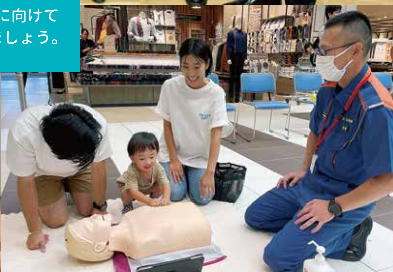
▲【左上】令和6年4月1日から「佐久地域平日夜間急病診療センター」を再開する診療室(浅間総合病院)【右上】佐久地域11市町村、小諸北佐久医師会、佐久医師会、浅間総合病院、佐久広域連合が連携(令和5年12月22日連携協定調印式)【右下】あなたの勇気が命を救う(令和5年9月9日救急フェア)【左下】地域医療をともにつくる「医師の働き方改革と持続可能な医療をみんなで考える」(令和5年7月22日JA長野厚生連等主催 農村医学夏季大学講座)