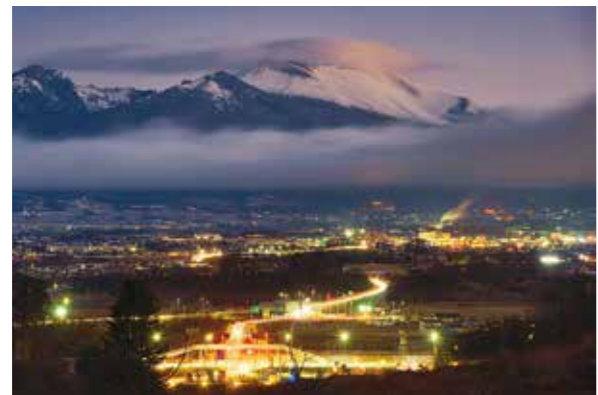
金賞「夜明待つ佐久南インター」 山口 敬一 様 撮影地：佐久市

【Instagram部門】 今回は、Instagram部門を設け、多数のご応募をいただきました。11点の入賞作品が決定しましたので一部をご紹介します。その他の入賞作品は佐久広域連合ホームページをご覧ください。