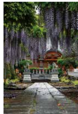
特選 撮影地：佐久市 円満寺

【Instagram部門】 今回は、Instagram部門を設け、多数のご応募をいただきました。11点の入賞作品が決定しましたので一部をご紹介します。その他の入賞作品は佐久広域連合ホームページをご覧ください。