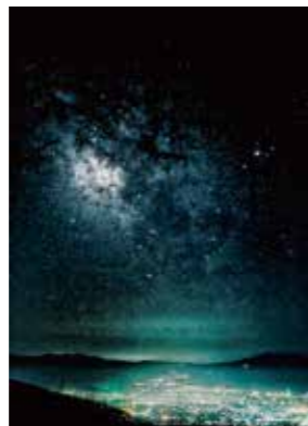
準特選 sunset_lover_yuki 様 撮影地：小諸市 高峰高原