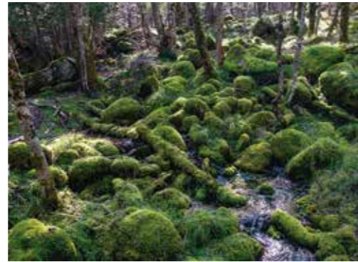
銀賞「緑苔の流れ」三井 仙一郎 様 撮影地：南牧村