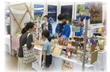
▲地域特産品の販売(佐久市振興公社)