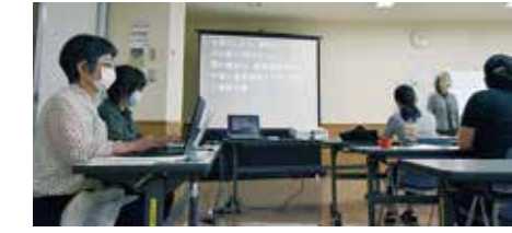
←講座の様子 やさしい内容の 入門編です。 お気軽に！

Q 要約筆記とは？ A その場の話の内容を要約し、文字で表して伝える通訳の方法です。 手話を主なコミュニケーション手段としない中途失聴者や中途難聴者に対して情報を伝える手段として用います。