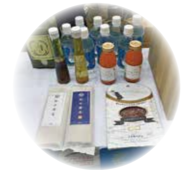
▲抽選会景品(南相木村産そば等)