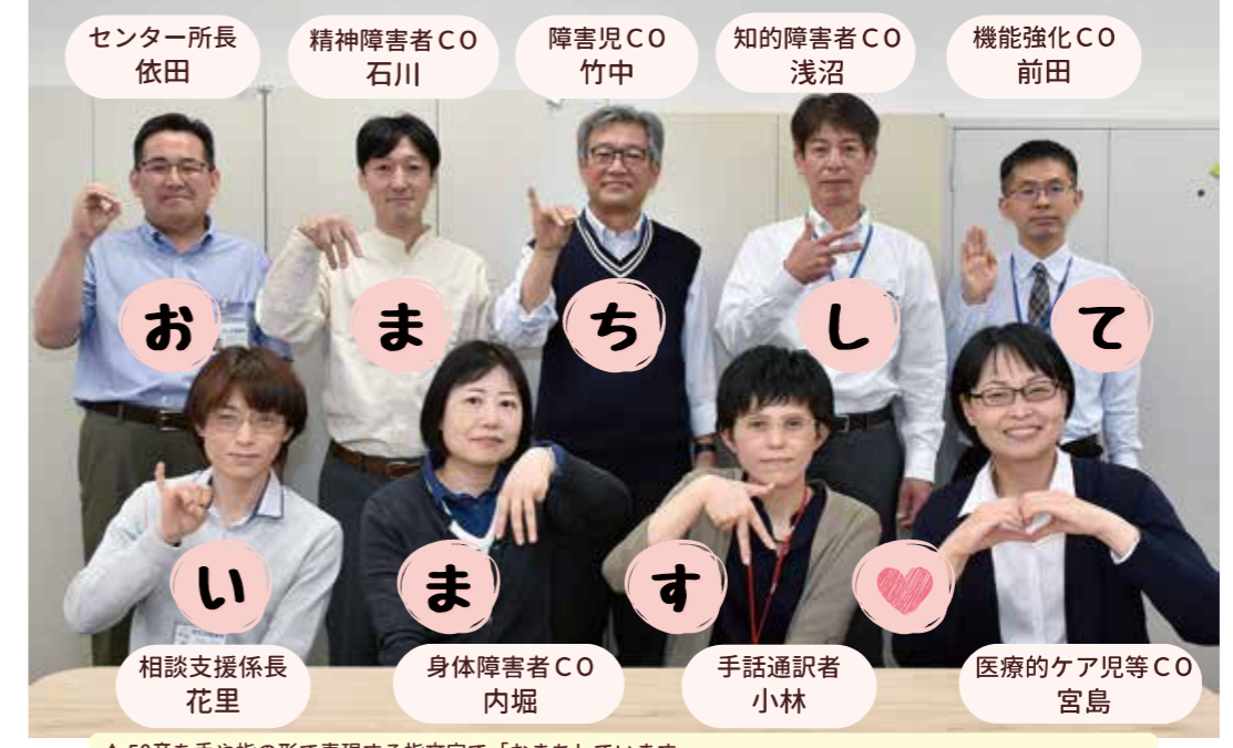
▲50音を手や指の形で表現する指文字で「おまちしています」 指文字は、手話を始めたばかりでまだ語彙が少ないときや、知らない単語をあらわすときなどにも使えます。