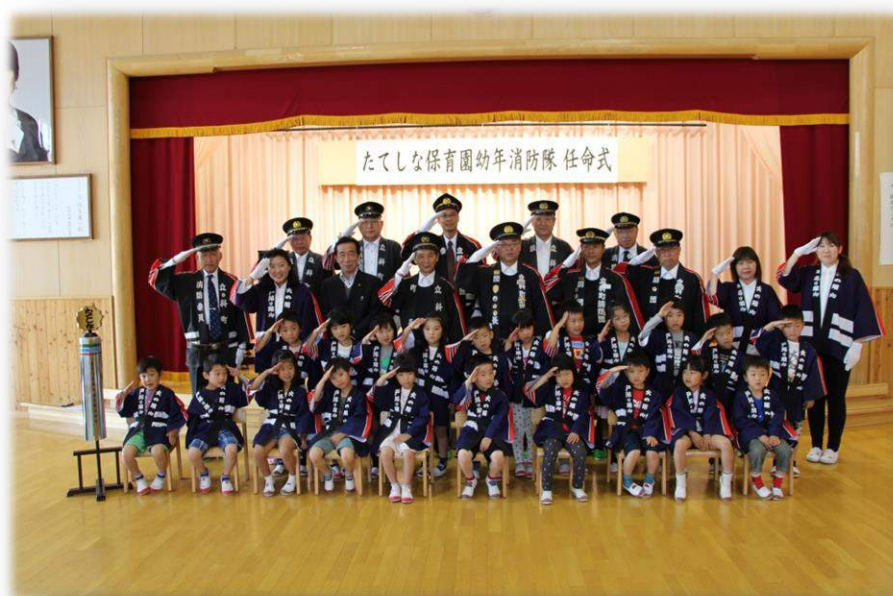
たてしな保育園 年長組