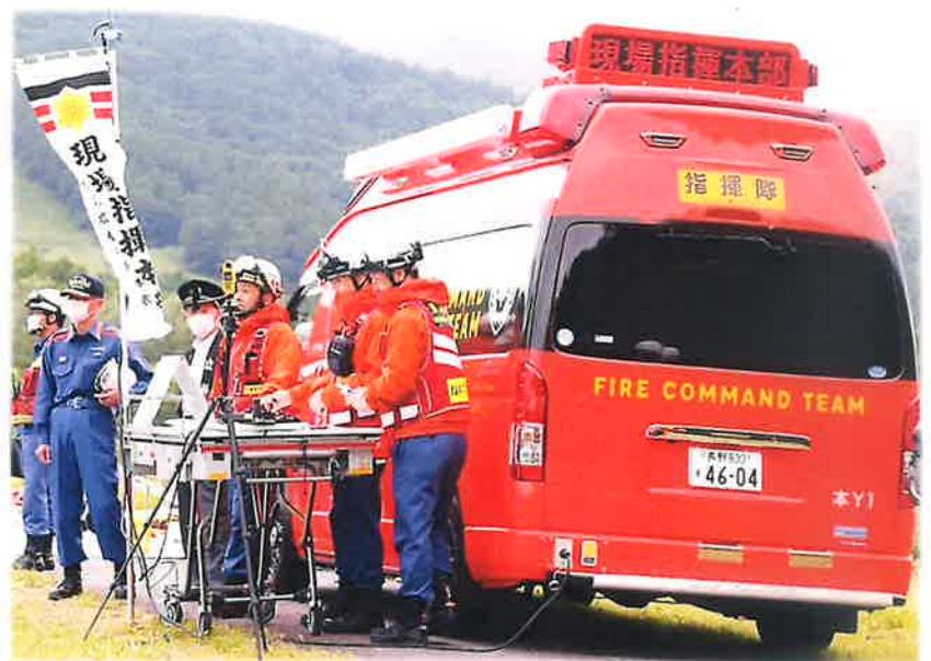
《水難救助訓練》 立科町女神湖