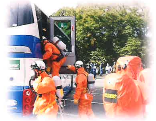
《官民一体型テロ対策訓練》 小諸市南城公園