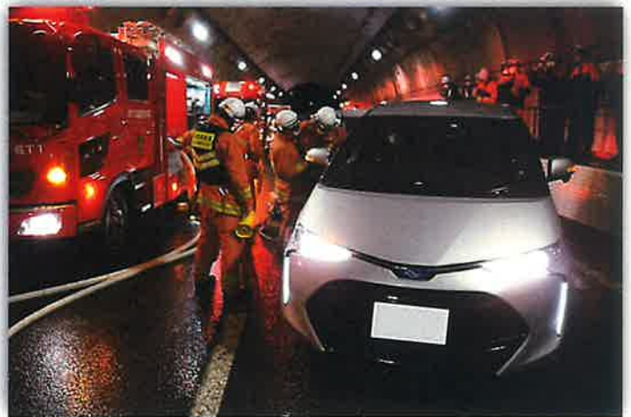
《八風山トンネル総合防災訓練》