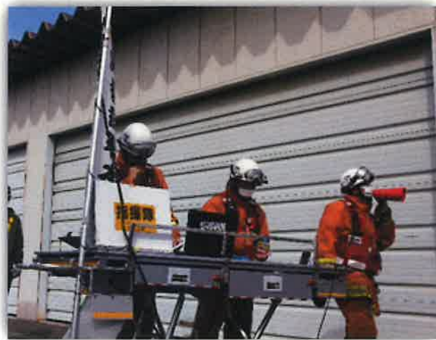
《長野県消防相互応援隊合同訓練》