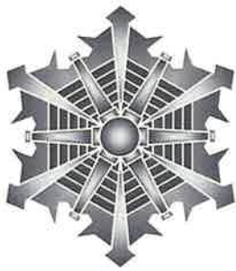
消 防 章