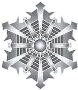
消 防 章