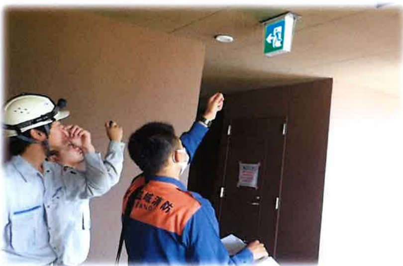
《防火対象物立入検査》