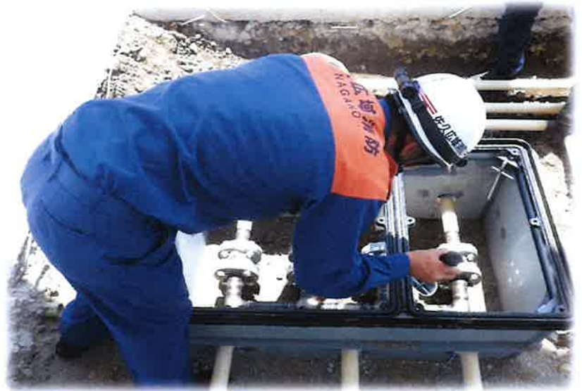
《危険物施設 配管検査》