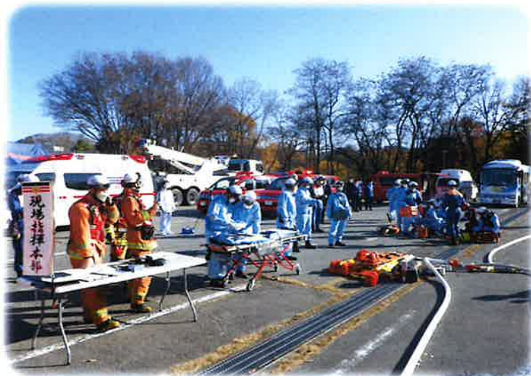
《協定先事業所等合同訓練 11/24》