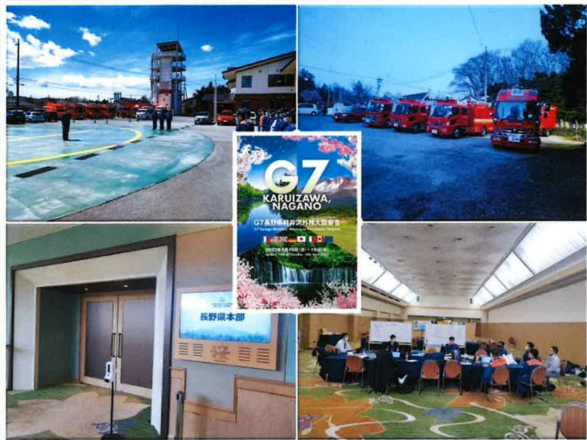
《G7長野県軽井沢外務大臣会合特別警戒体制 4/16～4/18》