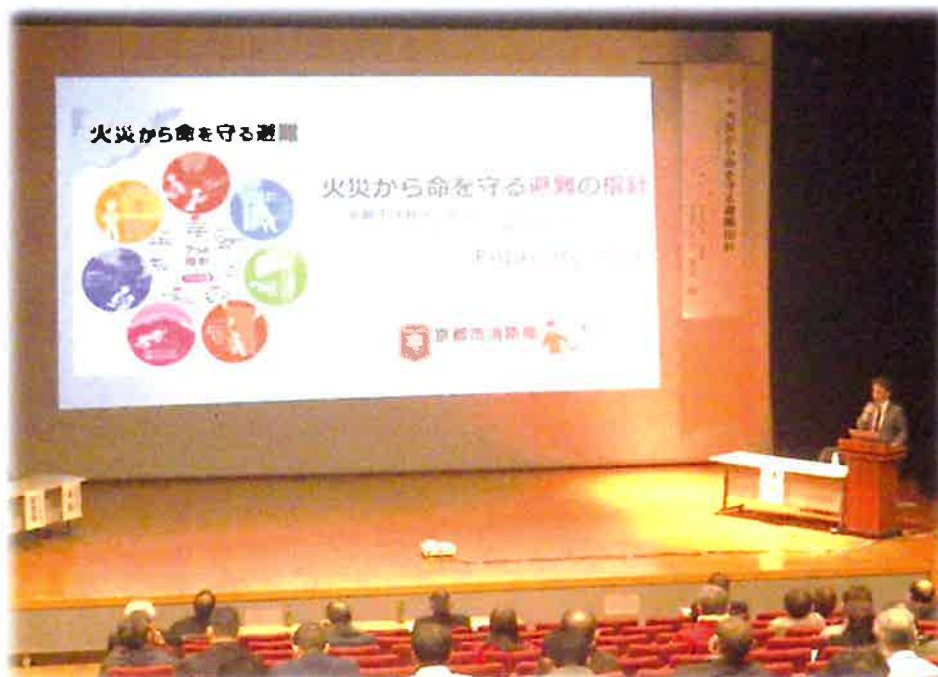
《防火管理者向上講習会》